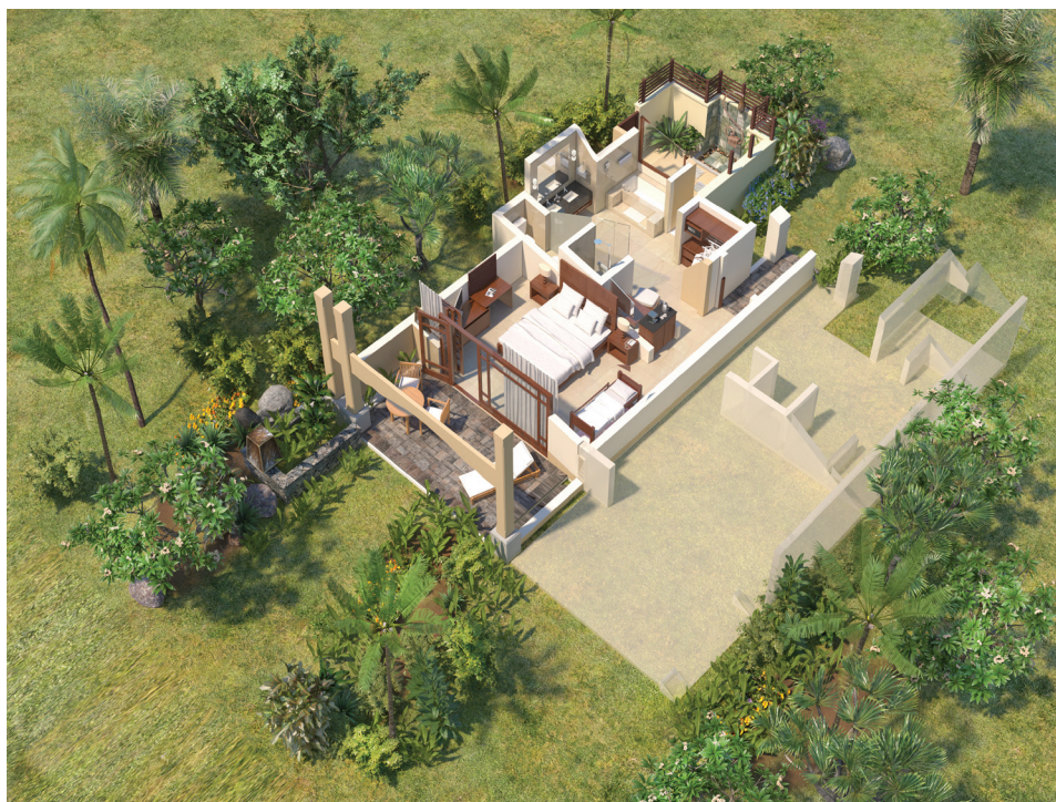
4 间精品直通沙滩套房(4)