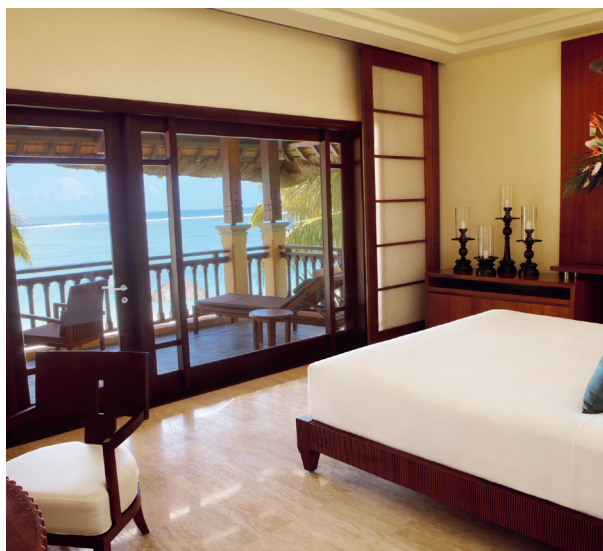
精品海景套房(6) (新增类型)